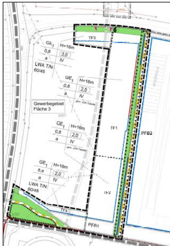
7. Änderung „Gewerbe- und Industriegebiet Oberheising“