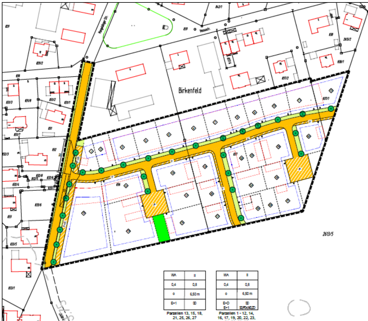
Bebauungsplan „Birkenfeld Süd-Ost“