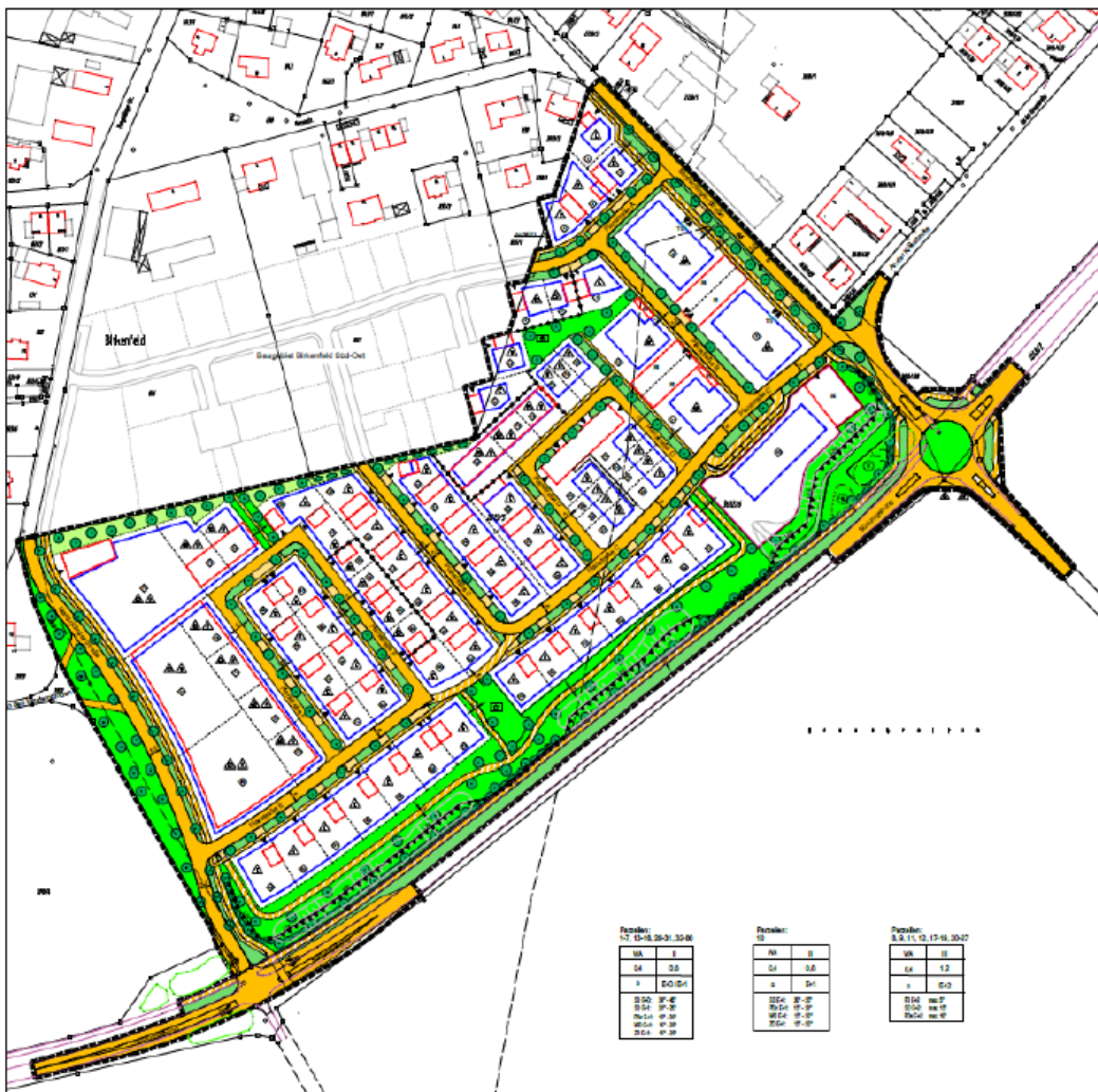
Bebauungsplanentwurf „Am Kleinfeld“